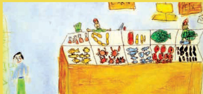
Un dels dibuixos que il·lustren el calendari. Autor: Paul Abelló

Aquest mes de desembre s'ha repartit el nou calendari de comerç per l'any 2010. En total, s'han editat 3000 exemplars. El repartiment dels calendaris el duen a terme l'Ajuntament i els establiments membres a l'associació de comerciants 365 Dies Salou Vila Comercial.