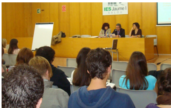
Primera sessió del seminari a l'IES Jaume Primer de Salou

Ajuntament de Salou Àrea de Promoció Econòmica Tel. 977 30 92 14. Passeig 30 d'Octubre, 4, 43840 Salou